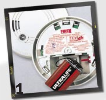
1 Lieferung inkl. Lithium-Batterie und Befestigungsmaterial