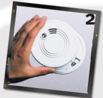
2 Einfachste Montage in wenigen Minuten