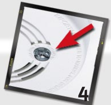
4 Testknopf zur Prüfung der Funktionsbereitschaft