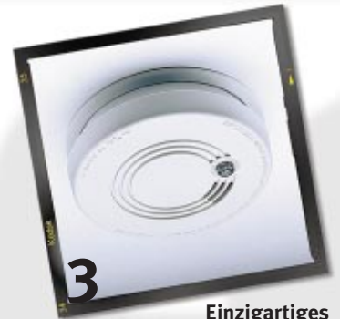
3 Einzigartiges Kompaktformat im schönen Design